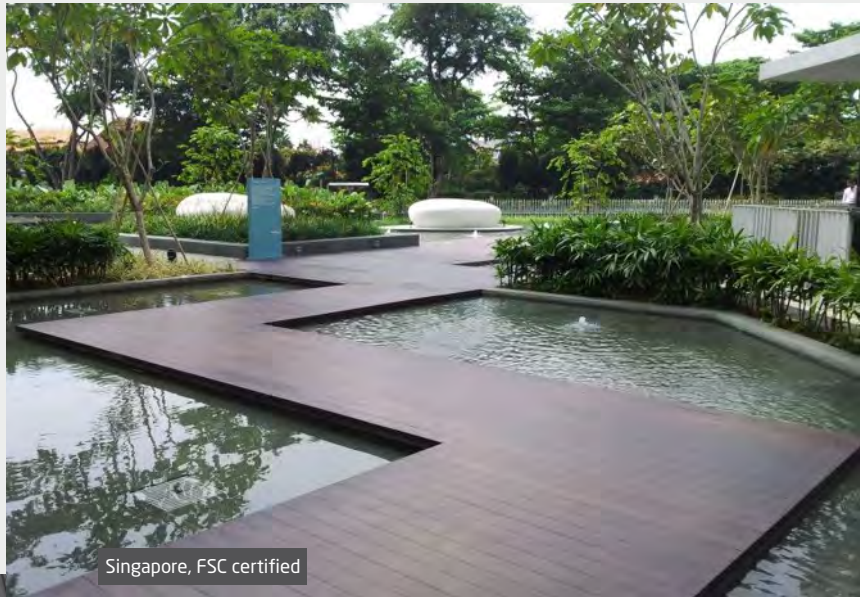
Singapore, FSC certified