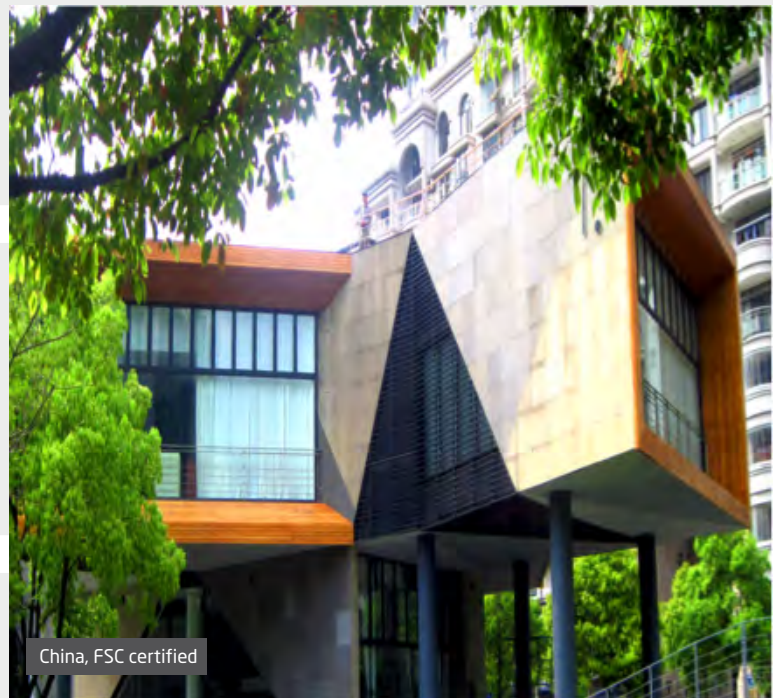
China, FSC certified

Accoya® and the Trimarque Device are registered trademarks owned by Titan Wood Limited, a wholly owned subsidiary of Accsys Technologies PLC, and may not be used or reproduced without written permission.