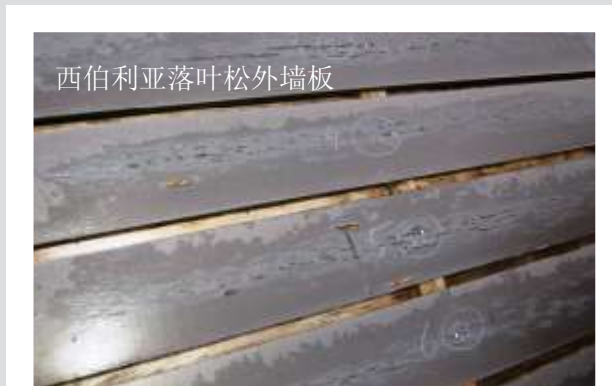
西伯利亚落叶松外墙板