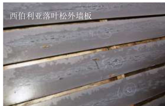
西伯利亚落叶松外墙板